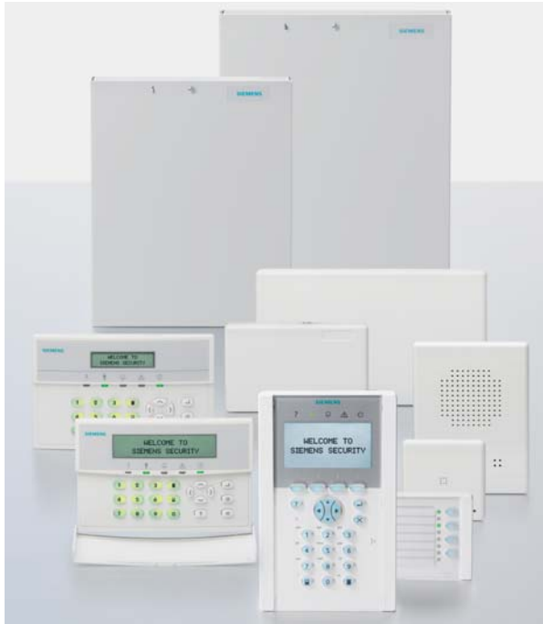
Umfangreiches Sortiment an Peripheriegeräten