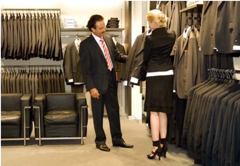
Maßgeschneidert für Haus, Gewerbe, Industrie